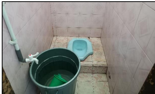
Gambar 5. Sanitasi Toilet

Toilet laki-laki dan perempuan terpisah dan masing-masing berjumlah 3 unit. Kebersihan toilet bukan hanya menjadi tanggung jawab pengelola masjid namun juga pengguna. Pengguna yang sadar dengan kebersihan akan menggunakan toilet dengan baik dan membuang sampah pada tempat yang telah disediakan (Purnamasari & Rangkuti, 2020).