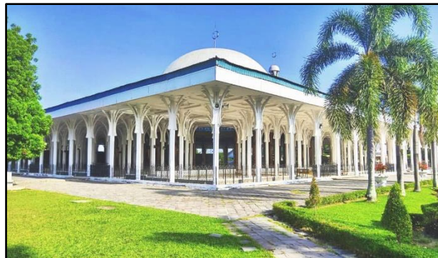
Gambar 1. Masjid Agung Al-Falah, Kota Jambi

untuk melaksanakan shalat berjamaah dan melakukan shalat sunnah. Masjid yang luas dan megah ini mampu menampung banyak jamaah yang datang dari berbagai wilayah sekitar.