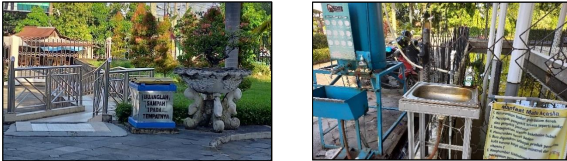
Gambar 4. Tempat Sampah dan Pencuci Tangan

pengunjung bertujuan untuk mendorong pengunjung agar lebih sadar akan kebersihan dan membuang sampah pada tempatnya. Selain itu, adanya tempat cuci tangan di pintu utama masjid bertujuan untuk meningkatkan kebersihan dan kesehatan pengunjung dengan memberikan akses yang mudah untuk mencuci tangan sebelum memasuki area masjid.