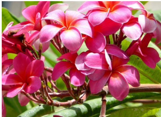
Gambar 1. Bunga Kamboja ( Plumeria rubra L. cv. Acutifolia )

Sampel bunga kamboja diambil dari pinggir jalan di sekitaran kampus UIN Ar Raniry Banda Aceh. Bagian tanaman diambil dengan menggunakan tangan (tidak menggunakan alat bantu) pada sore hari. Bagian yang diambil adalah kuncup bunga dan yang sudah mekar.