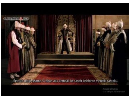
Gambar 2. Sultan Mahmed II kembali menaiki Tahta ( Fetih 1453 menit ke 00:08:20 – 00:08:45 )

Teknik pengambilan gambar yang terdapat dalam gambar 1 adalah Medium Shot , di mana Medium Shot ini merupakan teknik pengambilan gambar yang hanya dilakukan mulai dari pinggang sampai ke kepala, dan aspek mise en scene dalam gambar 1 ini adalah latar tempat ( setting ) dan kostum ( custom ), di mana latar tempat merupakan istana kesultanan sedangkan kostumnya merupakan ritual keagamaan yang biasanya dipakai oleh para Syeikh atau Sufi dalam islam.