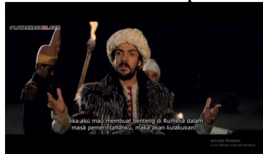
Gambar 6. Sultan Mahmed II membuat benteng di Rumelia ( Fetih 1453 menit ke 00:43:26 – 00:48:33 )

Sultan Mahmed II: Jika aku mau membuat benteng di Rumelia dalam masa pemerintahanku, maka akan aku lakukan. Pada scene dalam gambar 6 ini menceritakan bahwa Sultan Mahmed II ingin membuat benteng pertahanan di Rumelia dengan tujuan untuk menutup jalur perdagangan ke Konstantinopel dengan cara mecegah kapal – kapal dagang yang masuk dan akan berdagang di Konstantinopel. Pada pertengahan 1451, Sultan Mahmed II melakukan perjalanan pulang ke Edirne dari Bursa ia mendapati kapal – kapal Italia memblokir jalannya ke Galipoli, hal ini terpaksa membuat sultan memutar dengan melewati selat Bosphorus.