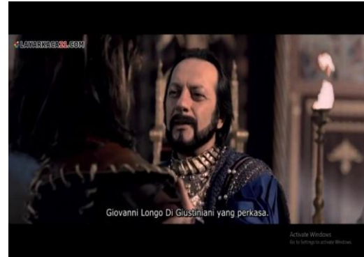
Gambar 11. Kedatangan Ksatria Gustiniani dari Genoa untuk membantu Konstantinopel ( Fetih 1453 menit ke 01:08:55 – 01:09:10)

Dalam adegan yang terdapat dalam gambar 10, teknik pengambilan gambar dilakukan dengan teknik Medium Close Up , di mana teknik ini hanya menampilkan mulai dari bagian dada sampai ke kepala dan sudut ( angle ) pengambilan gambar dalam adegan ini menggunakan High Angle Shot , tipe angle seperti ini, meletakkan kamera di atas objek dan kemudian bergerak turun ke bawah dengan tujuan membuat subyek terintimidasi. Untuk aspek mise en scene dalam adegan ini berupa latar tempat ( setting ) yaitu pabrik pembuatan meriam dan kostum ( custom ) yaitu kostum masyarakat pada era abad pertengahan ( medieval ).