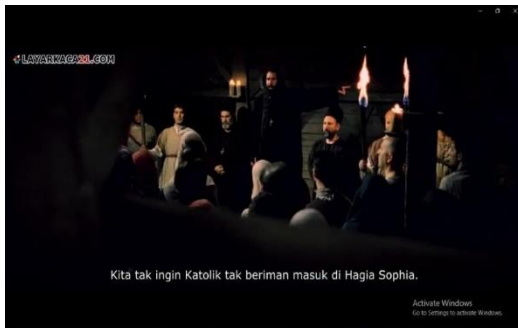
Gambar 9. Pemuka Agama bersama masyarakat Konstantinopel menolak masuknya Kristen Katolik ( Fetih 1453 menit ke 00:57:50 – 00:58:10 )

Utsmani, melainkan saudara seimannya sendiri yaitu Kristen Latin yang mensyaratkan unifikasi antara Gereja Roma Latin dan Gereja Ortodoks Yunani sebagai syarat mutlak untuk memberikan bantuan kepada Konstantinopel (As – Shallabi, 2003: 125). Teknik pengambilan gambar yang terdapat pada gambar 8 menggunakan teknik Medium Shot dengan aspek mise en scene nya berupa latar tempat ( setting ) yaitu di dalam benteng pertahanan dan kostum ( custom ) yaitu pakaian kekaisaran.