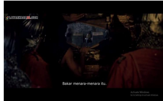
Gambar 14. Menara Kayu yang berjalan ( Fetih 1453 menit ke 01:45:17 )

Pada scene dalam gambar 13 rantai raksasa yang menjaga perairan Konstantinopel di Teluk Tanduk Emas ditarik, guna mencegah kapal-kapal Utsmani masuk. Pada saat yang bersamaan ketika Sultan Mahmed II membawa pasukannya untuk menyerang Konstantinopel, kaisar juga telah menyiapkan pasukannya. Gustiniani sebagai spesialis dalam mempertahankan kota berbenteng, dijadikan oleh kaisar sebagai panglima utama pasukan Konstantinopel. Kaisar merasa yakin bahwa kota Konstantinopel tidak akan jatuh ke tangan Turki Utsmani, dikarenakan temboknya yang kokoh, serta datangnya pasukan bantuan dari Eropa (Halil, 1960: 60 – 66). Pada saat itu juga kaisar memerintahkan agar rantai raksasa yang menjaga Teluk Tanduk Emas agar segera ditarik, guna mencegah kapal-kapal Turki Utsmani masuk ke perairan tersebut (Felix, 2017: 84). Aspek mise en scene yang terdapat dalam adegan ini adalah latar tempat ( setting ) yaitu Teluk Tanduk Emas ( Golden Horn ).