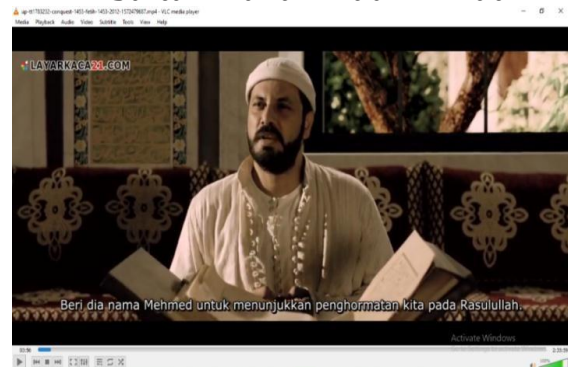
Gambar 1. Masa kelahiran Sultan Mahmed II (Fetih 1453 menit ke 00:03:23 – 00:04:04)

Pada Gambar 1 di atas menunjukkan bahwa Sultan Murad II, Beri dia nama Mahmed (Muhammad) untuk menunjukkan penghormatan kita kepada Rasulullah. Pada scene Gambar 1 ini menceritakan tentang kelahiran dari Sultan Mahmed II, berita dari kelahiran Sultan Mahmed II disampaikan oleh pelayan Sultan Murad II kepada Sultan. Kemudian sang Sultan menamakan anaknya Mahmed II. Sultan Mehmed lahir pada 27 rajab 835 H atau 30 Maret 1432 di kota Edirne, ibu kota dari Dinasti Turki Usmaniyah kala itu. Beliau merupakan putra dari Sultan Murad II yang merupakan Sultan keenam dari Daulah Utsmaniyah (Sodiqqin, dkk, 2022).