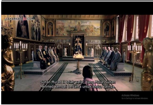
Gambar 3. Kaisar Kontantinus mendapatkan kabar bahwa Sultan Murad II telah wafat ( Fetih 1453 menit ke 00:10:20 – 00:10:36)

Gambar 3 di atas merupakan adegan disaat Sultan Murad II telah wafat yang mulia. Sultan Mahmed kembali bertahta untuk kedua kalinya. Pada scene dalam gambar 3 kaisar Konstantinus XI mendapat kabar dari mata – mata nya bahwa Sultan Murad II telah meninggal. Berita tentang meninggalnya Sultan Murad II ini disambut gembira oleh kaum Kristen Eropa terutama Konstantinopel (Felix, 2017). Masyarakat Eropa kala itu merasa tertekan dikarenakan Sultan Murad II banyak menaklukkan wilayah di Eropa, bahkan Paus sebagai pemimpin umat Kristiani pada masa itu merasa bahwa tindakan dari Sultan Murad II ini tercela, sehingga ia mengundang raja – raja di Eropa untuk menjalankan misi perang Salib baru.