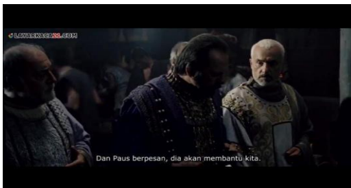
Gambar 8. Kaisar Konstantinus menerima pesan dari Paus (Felix 1453 menit ke 00:50:33 – 00:51:02)

Akibat dari adanya benteng pertahanan yang dibangun oleh Sultan Mahmed II tidak ada satupun kapal yang bisa melewati selat Bosphorous, Sultan Mahmed II juga telah memotong jalur perairan utama Konstantinopel serta menambah kepungan terhadap kota tersebut. dengan adanya pembangunan benteng ini, sultan juga dapat memantau logistik dan peralatan tempur Konstantinopel. Sehingga sultan bersama pengikutnya dapat menentukan taktik dan strategi perang untuk menaklukan kota tersebut (Ramzi, 2012: 55). Teknik pengambilan gambar yang digunakan dalam adegan ini adalah Medium Shot , mengambil gambar mulai dari badan hingga kepala, dan aspek mise en scene dalam adegan ini berupa latar tempat ( setting ) yaitu daerah Mora.