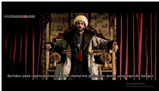
Gambar 5. Sultan menerima surat dari Eropa terutama Konstantinopel ( Fetih 1453 menit ke 00:15:33 – 00:16:25 )

Teknik pengambilan gambar dalam adegan pada gambar 4 adalah teknik Medium Shot . Untuk aspek mise en scene dalam adegan ini berupa latar tempat ( setting ) berupa istana kekaisaran serta kostum ( costum ) berupa pakaian kebesaran kekaisaran.