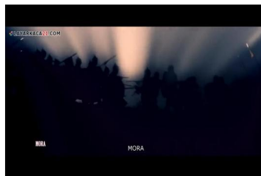
Gambar 7. Terjadinya perang di Mora ( Fetih 1453 menit ke 00:49:20 )

menggunakan teknik Medium Shot , dimana teknik ini mengambil dari mulai dada sampai ke kepala, sedangkan aspek mise en scene dalam gambar ini berupa pencahayaan ( lighting ) yaitu api dari obor dan kostum ( custom ) berupa kostum kesultanan.