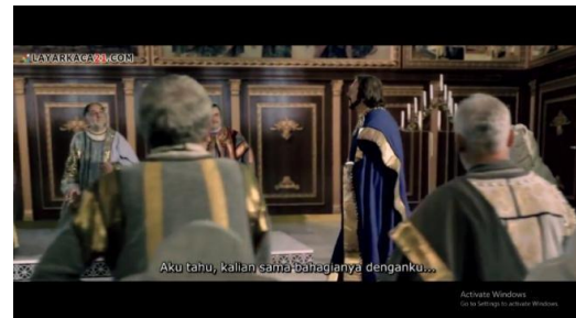
Gambar 4. Kaisar Konstantinus merasa gembira atas kabar wafatnya Sultan Murad II ( Fetih 1453 menit ke 00:10:40 – 00:10:47)

Konstantinopel. Hal ini dikarenakan Turki Utsmani dan Konstantinopel merupakan musuh bebuyutan. Adapun teknik pengambilan gambar yang terdapat dalam gambar 3 merupakan teknik Long Shot , teknik Long Shot ini merupakan teknik yang mengambil gambar dengan menampilkan seluruh tubuh manusia ataupun lebih. Untuk aspek mise en scene dalam adegan pada gambar 3 terdapat latar tempat ( setting ) berupa istana kesultanan dan kostum ( custom ) berupa pakaian kebesaran kekaisaran Konstantinopel.